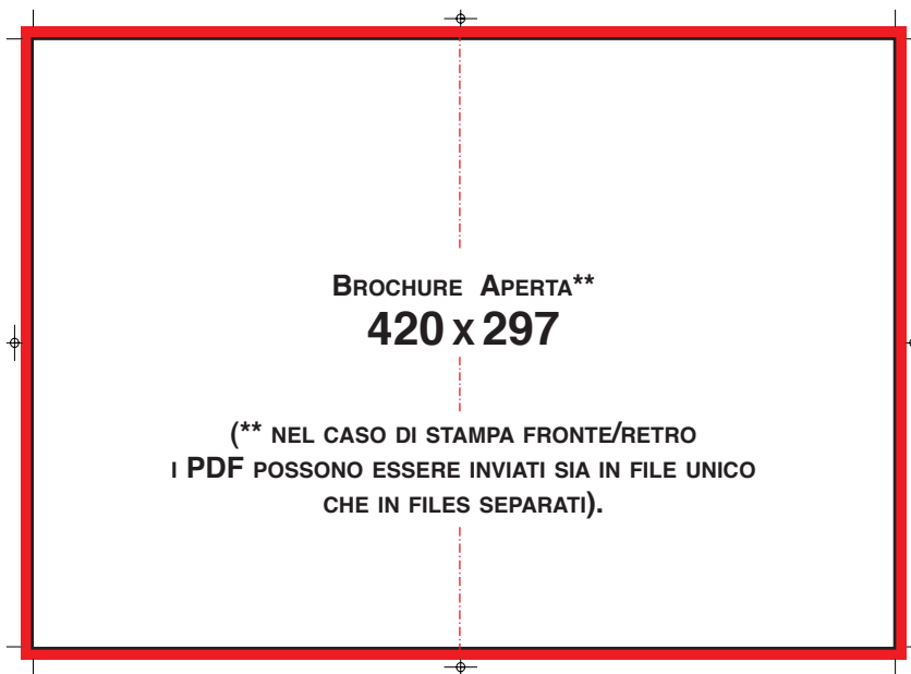
Brochure 4 pagine formato chiuso A4 (aperto A3)

MISURA DEL PDF COMPRESIVO DI ABBONDANZA DI 3 MM E SEGNI DI TAGLIO 430 x 307